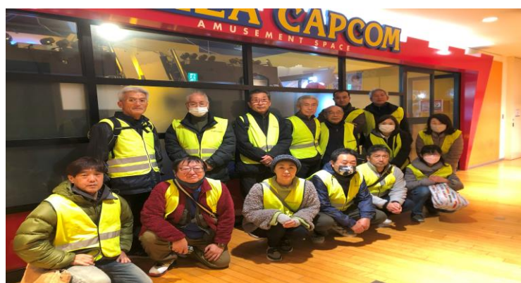
モアーズゲームセンターにて