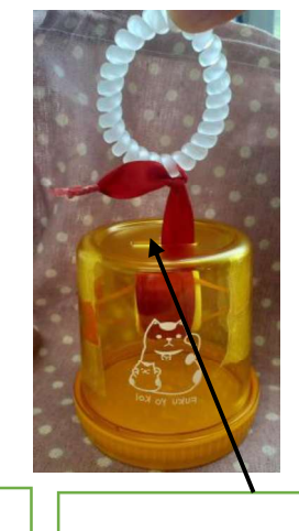
4 フタを閉じ、小銭 を入れる部分からリ ボンを出して完成。