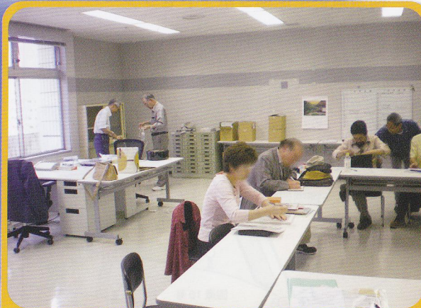
更生保護サポートセンター

保護司や保護司会が地域で更生保護活動を行う拠点として設置され、保護司の処遇活動に対する支援や関係機関との連携による、地域ネットワークの構築等を行っています。