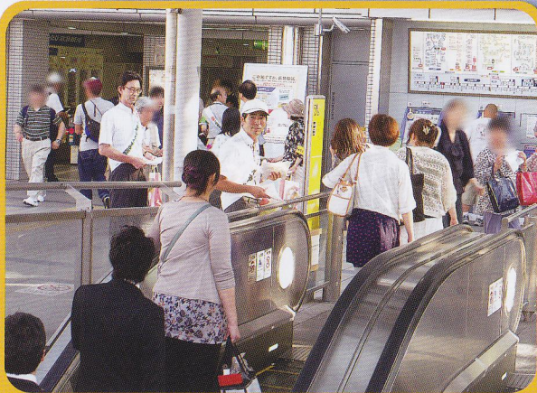
“社会を明るくする運動”街頭啓発活動