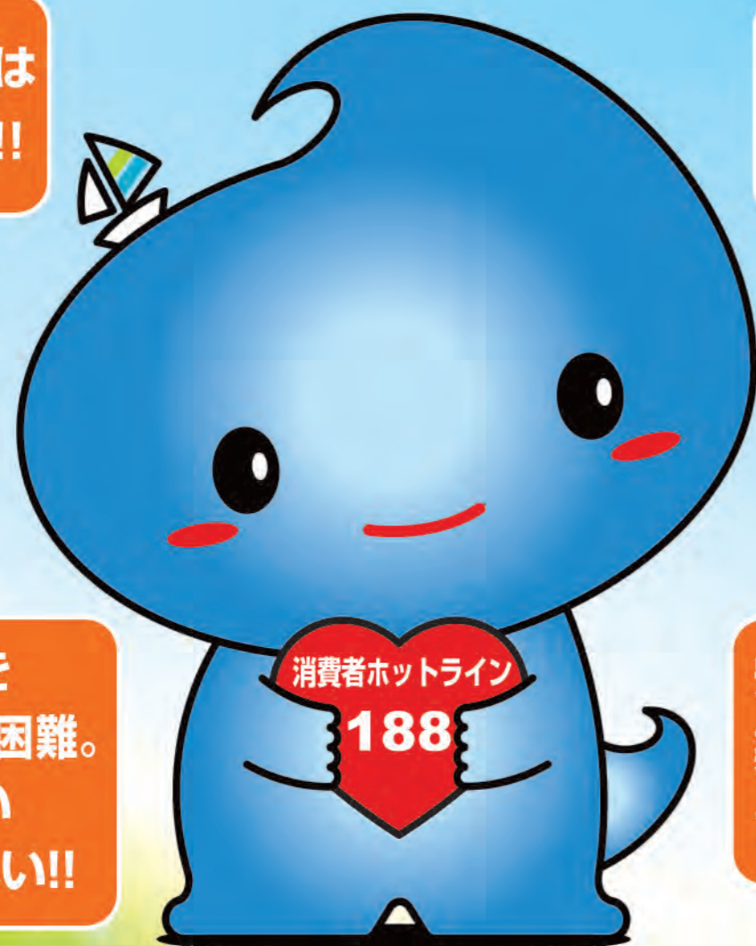
横須賀市マスコットキャラクター スクリン