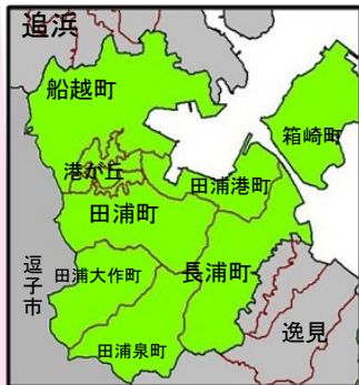
田浦地域運営協議会の地域