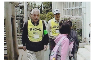
パトロール中の千秋隊長