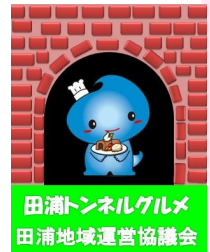
田浦トンネルグルメ 田浦地域運営協議会