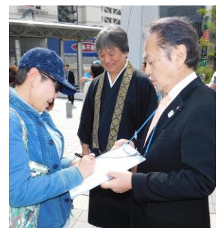
上地市長も呼び掛け

署名活動は今後 2 年間継続して実施していきます。署名の用紙は、逸見行政センターにあります。ぜひご協力ください。