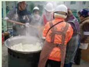
給食給水チーム 大釜でふっくらと炊きあがったご飯。「10年やってるからね」