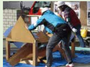
救出救護チーム 模型を使った倒壊家屋からの救出、重症患者の搬送、心肺蘇生訓練