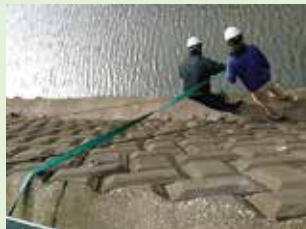
消火チーム 電動ポンプで防火用水の揚水対応「あっ、水が出てきた！」