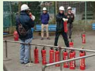
消火チーム リーダーによる消火器取扱い説明のあと、参加者による消火訓練