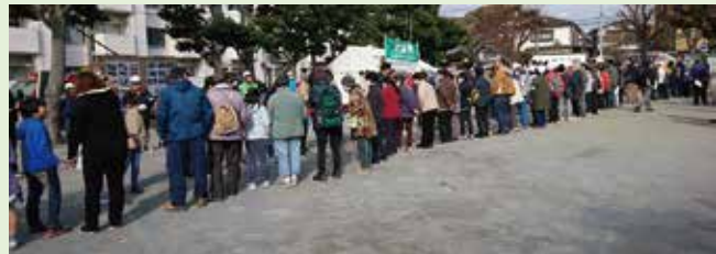
参加者全員でのバケツリレー 「本公郷町内会のキズナを作るために力を貸してください！」