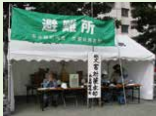
災害対策本部 情報連絡チームと無線機で連携