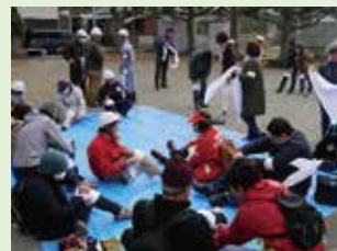
避難誘導チーム 避難誘導後、負傷者への応急処置、高齢者の避難支援の対応訓練