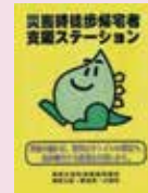
その他（ガソリンスタンド）