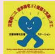
コンビニエンスストア