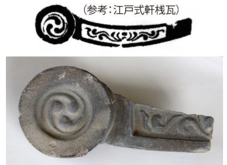
白洲跡出土の軒棧瓦

その付近で発見された礎石は、径約四〇〜六〇センチ前後のやや扁平な山岩で、白洲部分には貝殻混じりの砂礫が敷かれています。また、白洲部分の南側には白い漆喰が付着した棧瓦片がまとまって出土し、裁許の間の礎石が接した位置から軒棧瓦片が出土しました。 この瓦の瓦当部の軒丸部分は三つ巴文のみで珠文がなく、軒平部分は唐草文で第二唐草の先端が上向きで終わることなどから、江戸遺跡（東京都）の近辺で焼かれた江戸在地系（江戸式）の特徴を持つことがわかります。 浦賀奉行所跡では東海地方産（東海式）の瓦も出土していますが、この時期はその両者が使われていたようです。