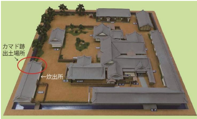
嘉永6（1853）年頃の浦賀奉行所（浦賀コミュニティーセンター分館所蔵模型）

令和元年度（二〇一九年）の確認調査で、本体部分の白洲の一部とその周辺が発見されました。物絵図の間取り等から、裁許の間と前面の板敷き部分、そして砂礫が敷かれたいわゆる白洲部分と考えられます。