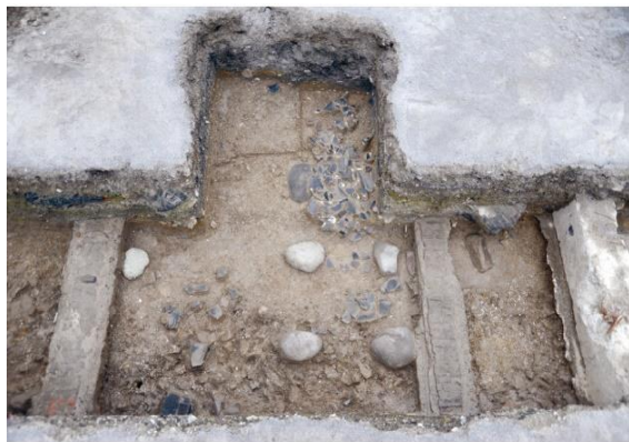
第II期の白洲跡（西側から）