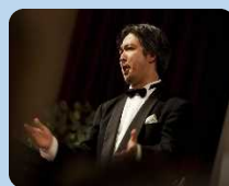
バリトン 宮本史利