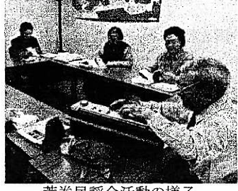
荒巻民謡会活動の様子