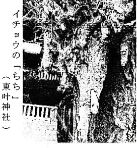
イチョウの「いちち」 (東叶神社)

にも雌木にも枝とは別に乳房を思わせる「いちち」が出来ます。気根に似ていますが、その先端や側面から枝を出すので栄養繁殖を行う特殊な器官と解釈されています。