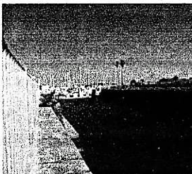
玉葉製造所があった「館浦」の現在