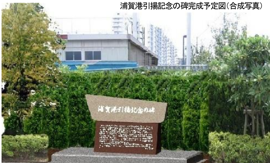
浦賀港引揚記念の碑完成予定図(合成写真)

※除幕式 十月七日(土) 十時三十分 於・西浦賀みなど緑地 ※浦賀港引揚船関連写真展 十月二日(月)〜 十月七日(土) 於・浦賀行政センター