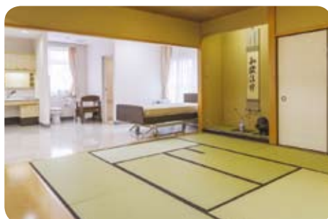
在宅看護実習室（茶室兼用）