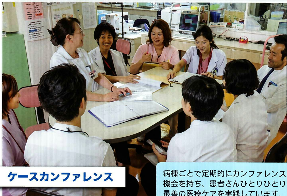
ケースカンファレンス

多職種協働で毎週1回各病棟を回診し入院患者さんが口から食べることのお手伝いをしています。