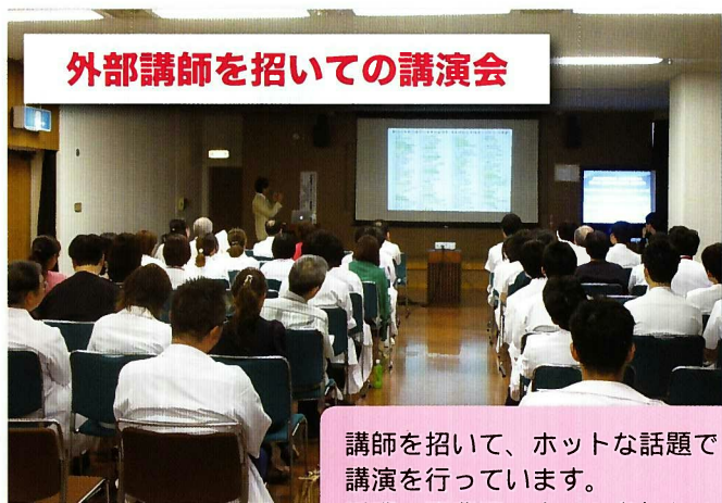
外部講師を招いての講演会

講師を招いて、ホットな話題で講演を行っています。近隣の開業医の方々も参加します。