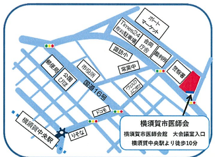
横須賀市医師会館 案内図

【お問合わせ・申込先】 一般社団法人 横須賀市医師会 TEL:822-0542 FAX:823-4534