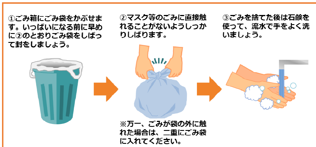
図1 新型コロナウイルス等の感染症の感染者又はその疑いのある方の使用済みマスク等の捨て方(環境省)