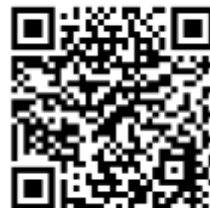
横須賀市予約システム

※Microsoft Internet Explorer 11.0、Microsoft Edge、Google Chrome 最新版、Firefox 最新版のいずれかのブラウザからアクセスしてください。