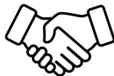
③地域のネットワークづくり