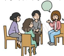
⑤住民への普及啓発