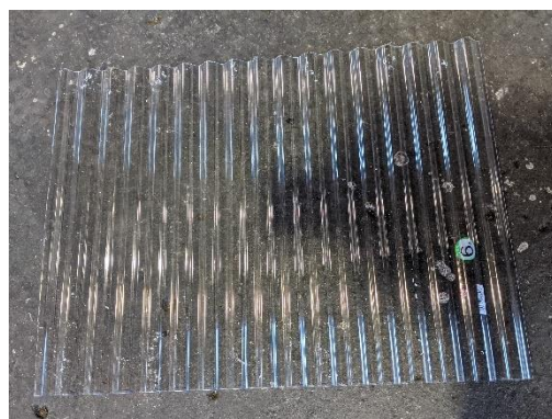
No. 2 波板 (透明)