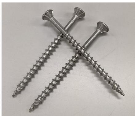
No. 5 ビス