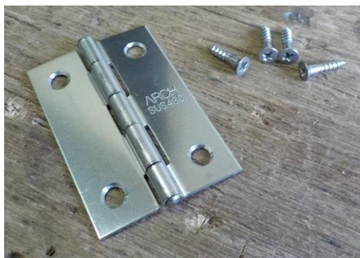
No. 6 丁番