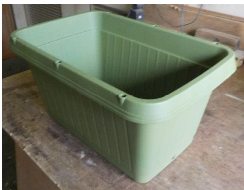
No. 1 プランター