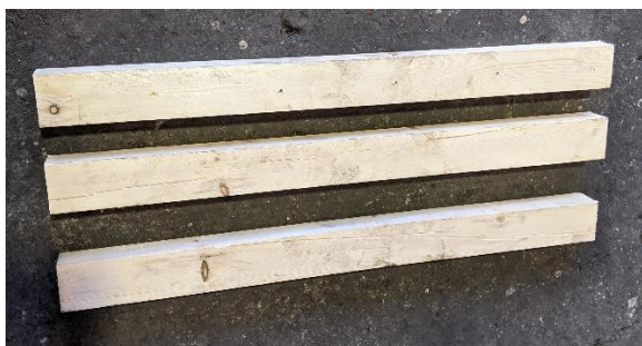
No. 3 木材