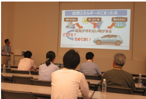
① 講義 地球温暖化と電気自動車