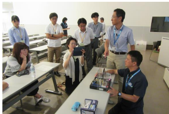
② 「わくエコ」体験 (モーターのしくみ)