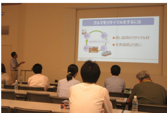
⑤ リサイクル (リーフは再生可能率 95%)