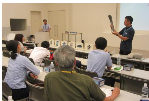
⑥ クイズ(何を再利用しているかを当てる)