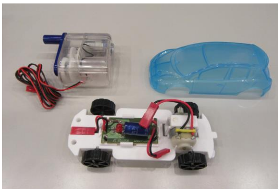
③ 体験キット (日産リーフモデルカー)