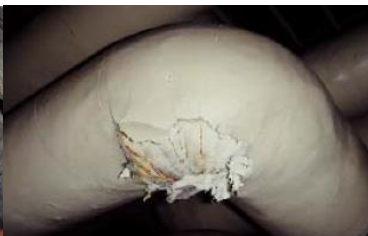
エルボ部に使用 石綿含有保温材