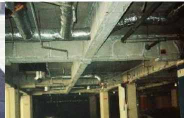
鉄骨を被覆して保護 石綿含有耐火被覆材