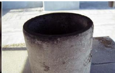
煙突の内側に使用 石綿含有断熱材