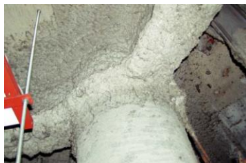
柱や梁に施工 吹付け石綿