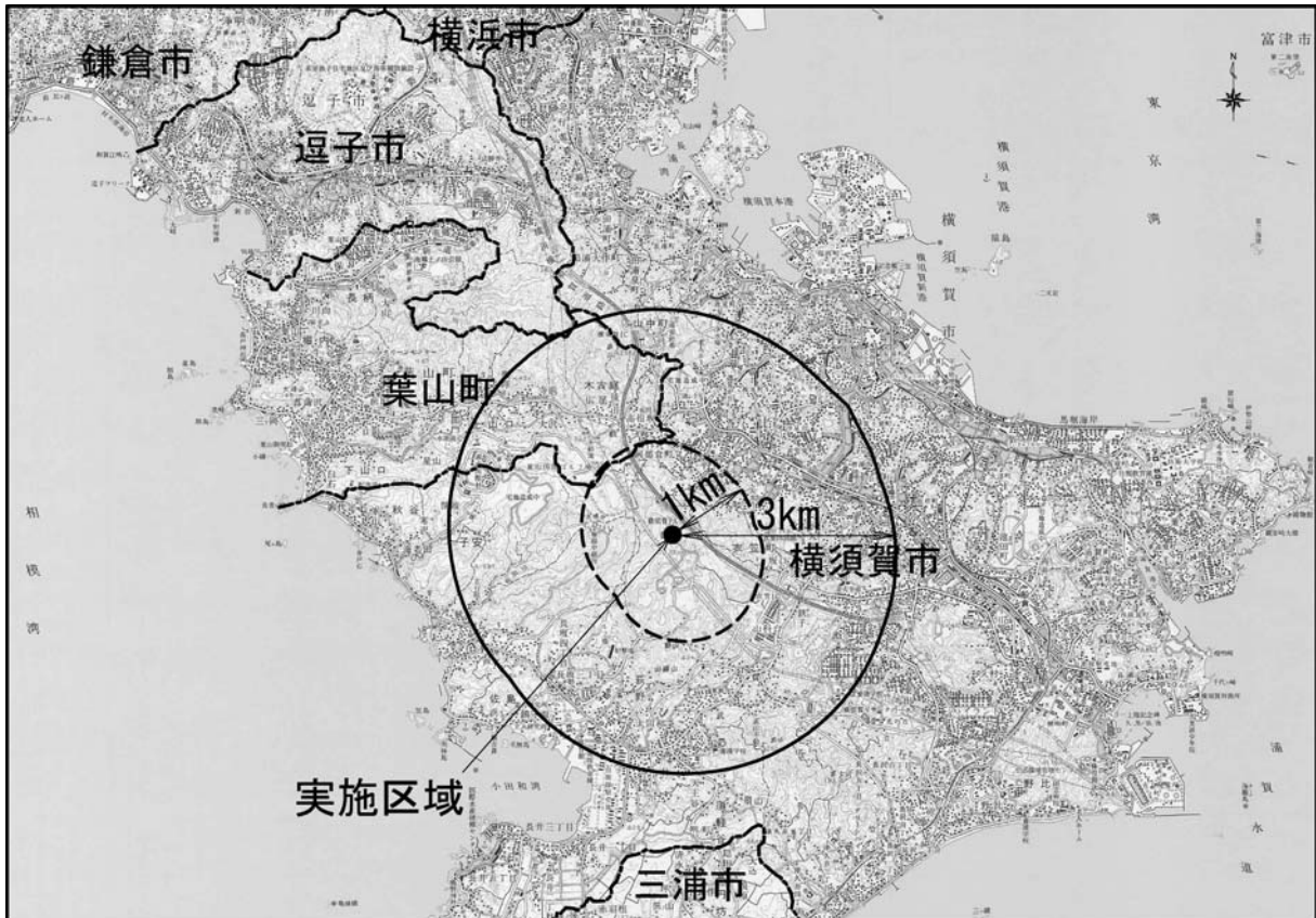
図 2-2-1 実施区域の位置

周知範囲となる実施区域の周囲 3 km の範囲には、葉山町、逗子市の一部が含まれる。