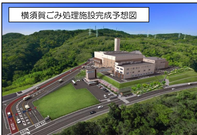
横須賀ごみ処理施設完成予想図

工事は、平成 31 年度（2019 年度）の稼働に向けて順調に進められています。 今回は、今年度の工事の進ちょく状況についてお知らせします。