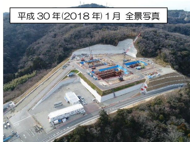
平成 30 年(2018 年) 1 月 全景写真