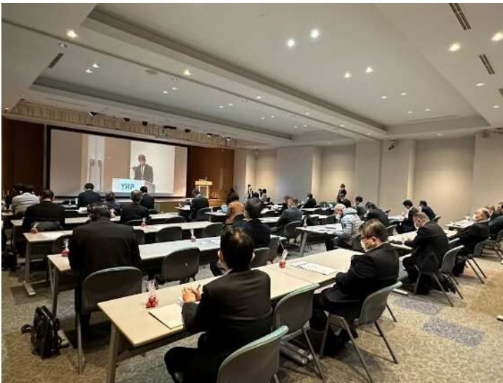
YRPちょっと最新セミナーの様子 @YRPセンター1番館 YRPホール