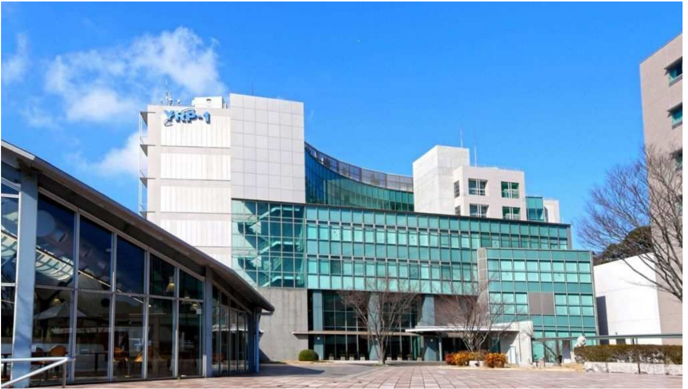
当社が運営管理するYRPセンター1番館