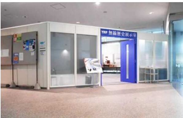
総合的な学習の一環としてYRP見学 をする地元中学生の様子 @YRPセンター1番館 無線歴史展示室