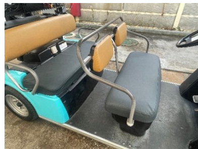
ゴルフカート用シートヒーター

射出成型機 100t～1,300t（23台） CAD・CD/CAM（8台） NC加工機（9台） めっきライン （24タンク/H・500タンク/日）一式 塗装ライン （17ブース内口ポットブース14台）一式