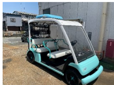
ゴルフカート用クーラー

樹脂製品 （マーク、グリル、パネル） 金属製品（バンパー） 機能めっき製品（成形機部品） その他（技術支援等）