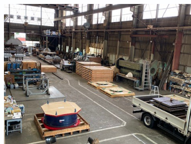
工場内観(組立工場)