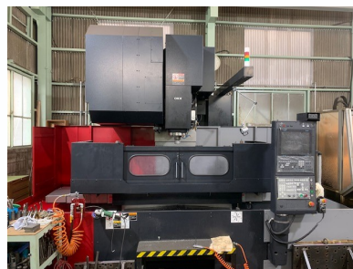
主要縦型マシニングセンター

業 種 輸送用機械器具製造業 電話番号 046-835-2605 F A X 046-834-5459 メール info@koizumi-seiki.co.jp 住 所 横須賀市内川1-8-21 資本金 350万円 従業員 7名