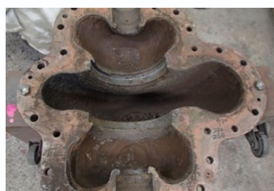
FC製ポンプケーシング 補修前

船舶用ディーゼルエンジンの修理 プラント会社設備機器全般補修 金属溶接板金加工 金属切削、研削、研磨加工 歯車の設計、製作 工作機械・エンジン ・機械要素を使用した装置・機械 <加工可能材質> 鉄・アルミ・ステンレス・樹脂・銅