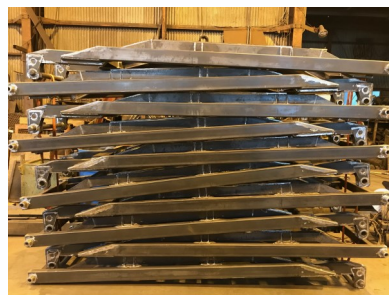
トラック架台部品

業 種 輸送用機械器具製造業 電話番号 046-835-9516 F A X 046-835-9132 メール — 住 所 横須賀市内川1-4-23 資本金 1,000万円 従業員 8名