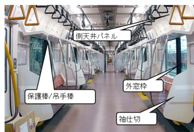
鉄道車両内装部品

鉄道車両部品 各種鉄道車両ドア 各種鉄道車両内装パネル 各種鉄道車両内装部品 (下降窓装置、外装窓、袖仕切、握棒、他)