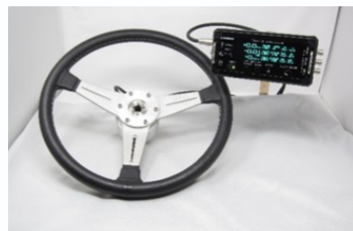
ハンドル操舵角力計