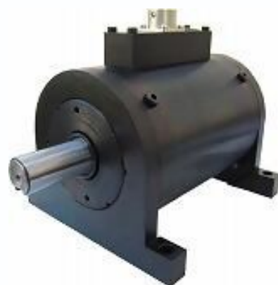
非接触式トルク変換器

ロードセル トルクメーター スリップリング 圧力変換器（負圧対応） 自動車用計測器各種 （ハンドル操舵力計等） 表示器