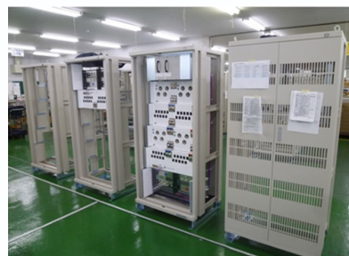
通信インフラ製品

5面加工機 門型マシニング 高出力レーザー複合機 レーザー複合機 25t 2500×1525 3次元測定機 周波数変換装置(松永製作所) デジタルオシロスコープ(テクトロニクス) ユニバーサル漏洩電流計(YOKOGAWA) 絶縁耐圧抵抗試験器(菊水)