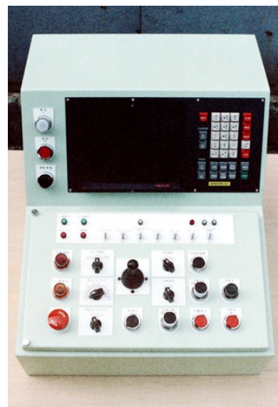
ファナック製NCを組み込んだ装置の操作卓