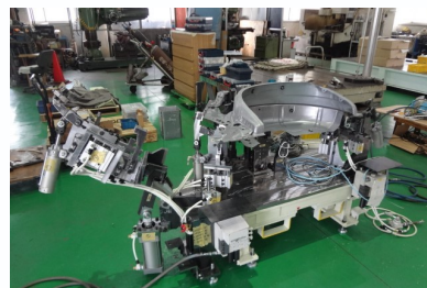
組付け治具 (数パーツを1部品にする装置)