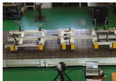
車両フロア組付用治具 (ロボット対応)