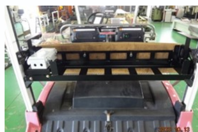
ゴルフカートACバッテリーラック