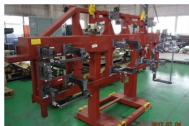
解析治具 (プレスにてパネルを成形した後の精度確認)