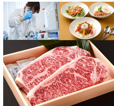
(写真左上)検査の様子 (写真右上)株主優待用の大豆ミート製品 (写真下部)黒毛和牛サーロインステーキ

コロワイドMDの国内全工場にて食品安全マネジメント規格「JFS-B」認証の取得を完了しています。神奈川工場は2022年12月22日に適合証明され、フードサプライチェーン全体における食の安全・安心が提供できるように食品の安全管理レベルの向上に努めています。工場内に品質検査部門も設けており、日々商品の安全・安心の担保に取り組んでいます。