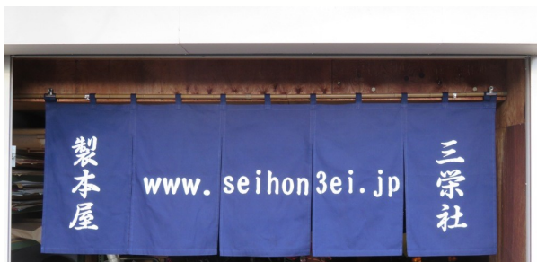
いらっしゃいませ