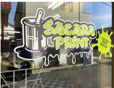
ステッカー・切り文字