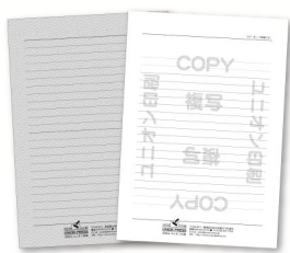
大型ポスター出力・コピーガード印刷