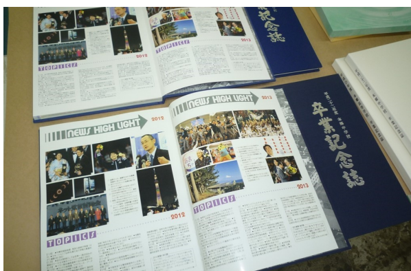
卒業アルバム複製