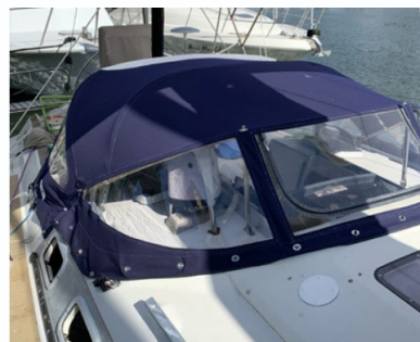
ドジャー(カバー類)