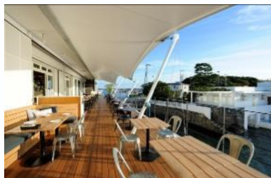
SAILTECハイパーテント(底部分)