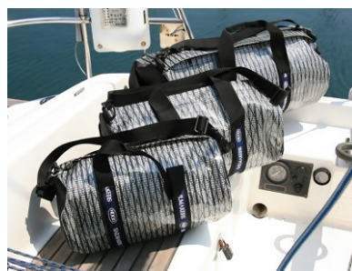
ドジャー(カバー類)