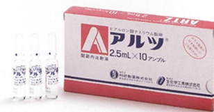
関節機能改善剤「アルツ」