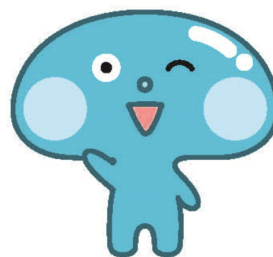
マスコットキャラクター 「ヒアルンくん」