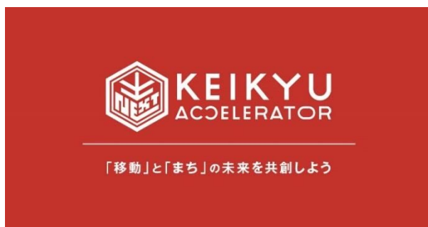
KEIKYU ACCELERATOR PROGRAM

京急電鉄では，スタートアップの革新的なアイデアや技術を融合させることで，横須賀市が抱える地域課題の解決を目指すとともに，魅力ある沿線のまちづくりに共に取り組む共創パートナーからのご応募をお待ちしております。