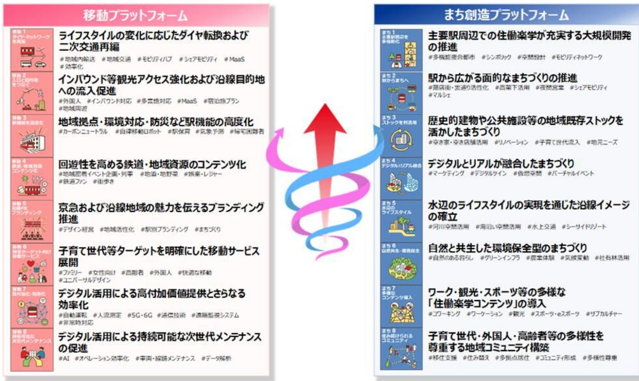
移動とまち創造プラットフォームの事業方針と施策のポイント（キーワード）

本戦略のもと，「移動プラットフォーム」では，MaaS 基盤の整備等を通じた新たな移動需要を創出し，「まち創造プラットフォーム」では，エリアマネジメント活動を推進することで地域の賑わいとつながりを強化し，外部を巻き込んだ地域内の共創を目指していきます。