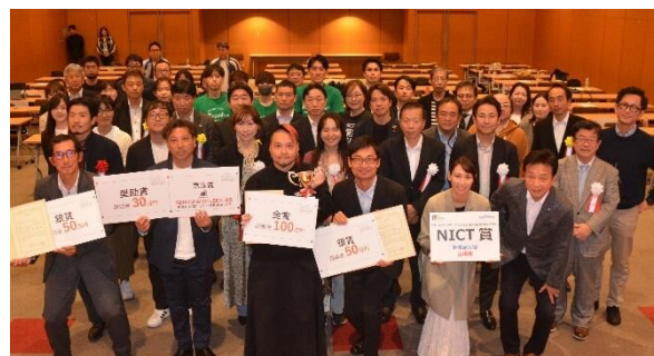
スタートアップオーディション in YOKOSUKA（昨年度）