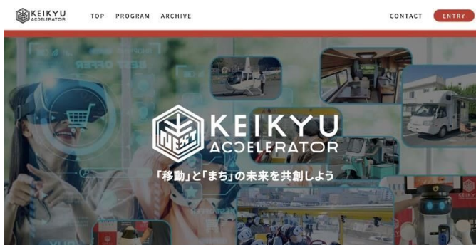
KEIKYU ACCELERATOR PROGRAM WEBサイト

京急電鉄では，地域課題の解決に向けた具体的取り組みと，スタートアップのアイデアを融合させることで，横須賀市が抱える地域課題の解決を目指すとともに，再開発が進む横須賀中央駅・追浜駅などのまちづくりの共創パートナーと新規事業創出などに取り組んでまいります。詳細は別紙のとおりです。