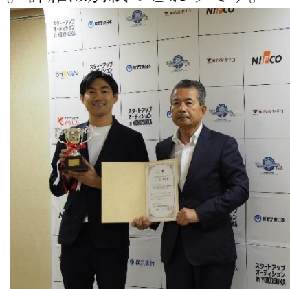
スタートアップオーディション in YOKOSUKA（昨年度）