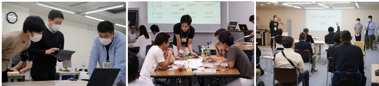
過去に実施した「アトツギ新規事業開発プロジェクト」より