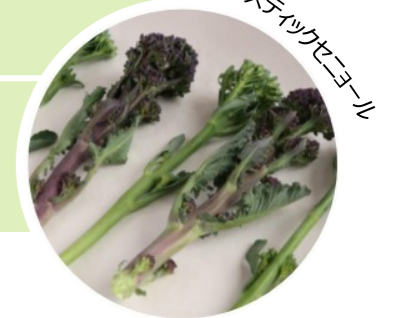
スティックセニョール