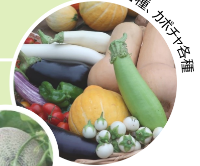
ナス各種、カボチャ各種