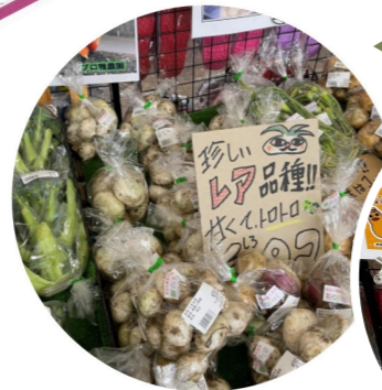
ソレイユの丘マルシェ