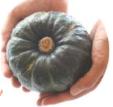
ぼっちゃんカボチャ