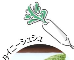
タイニーシュシュ