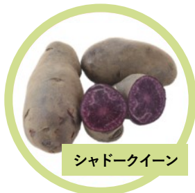
シャドークイーン