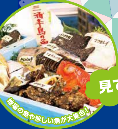
三浦半島の新鮮な魚がよもどり!セリ販売も!

交通 ・京急線堀ノ内駅から徒歩約9分 ・京急線横須賀中央駅付近から 無料送迎バスあり