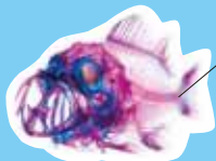
アカメバル 3階「透明標本」 展示イメージ