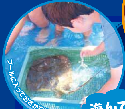
ネットに入っておさかなにタッチ!