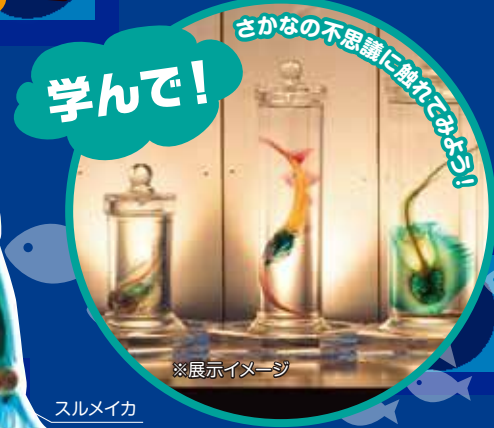
さかなの不思議に触れてみよう!