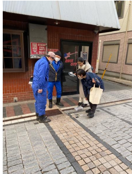
色彩相談のアドバイス事例（左：汐入ポンプ場外装ほか更新工事、右：どぶ板通りの舗装補修工事）