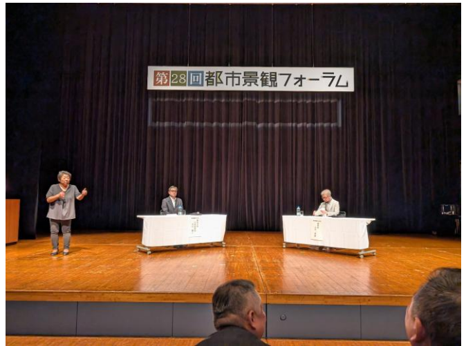
(左：1部 基調講演の様子 右：2部 ディスカッションの様子)