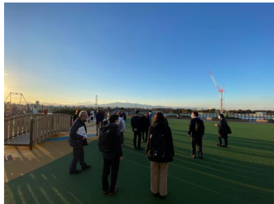
（左：2024年7月開業 ゆめが丘ソラトス内の会議室での様子 右：ゆめが丘ソラトス屋上広場での様子）