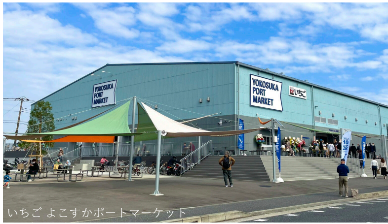
いちごよこすかポートマーケット