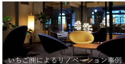
いちご(株)によるリノベーション事例