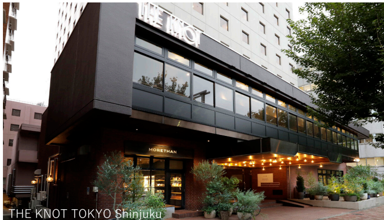
THE KNOT TOKYO Shinjuku