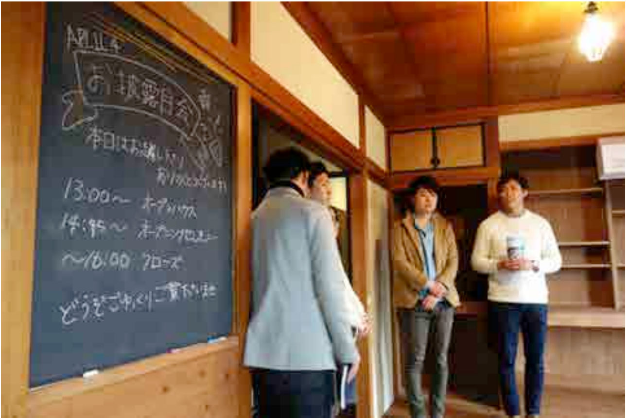
共用部 LDK（黒板に、居住者同士の連絡や当番などを書き込もう）