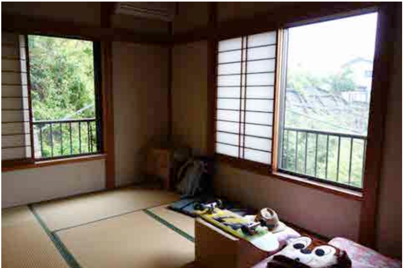
個室 2階6畳和室（個室には鍵がつきます）