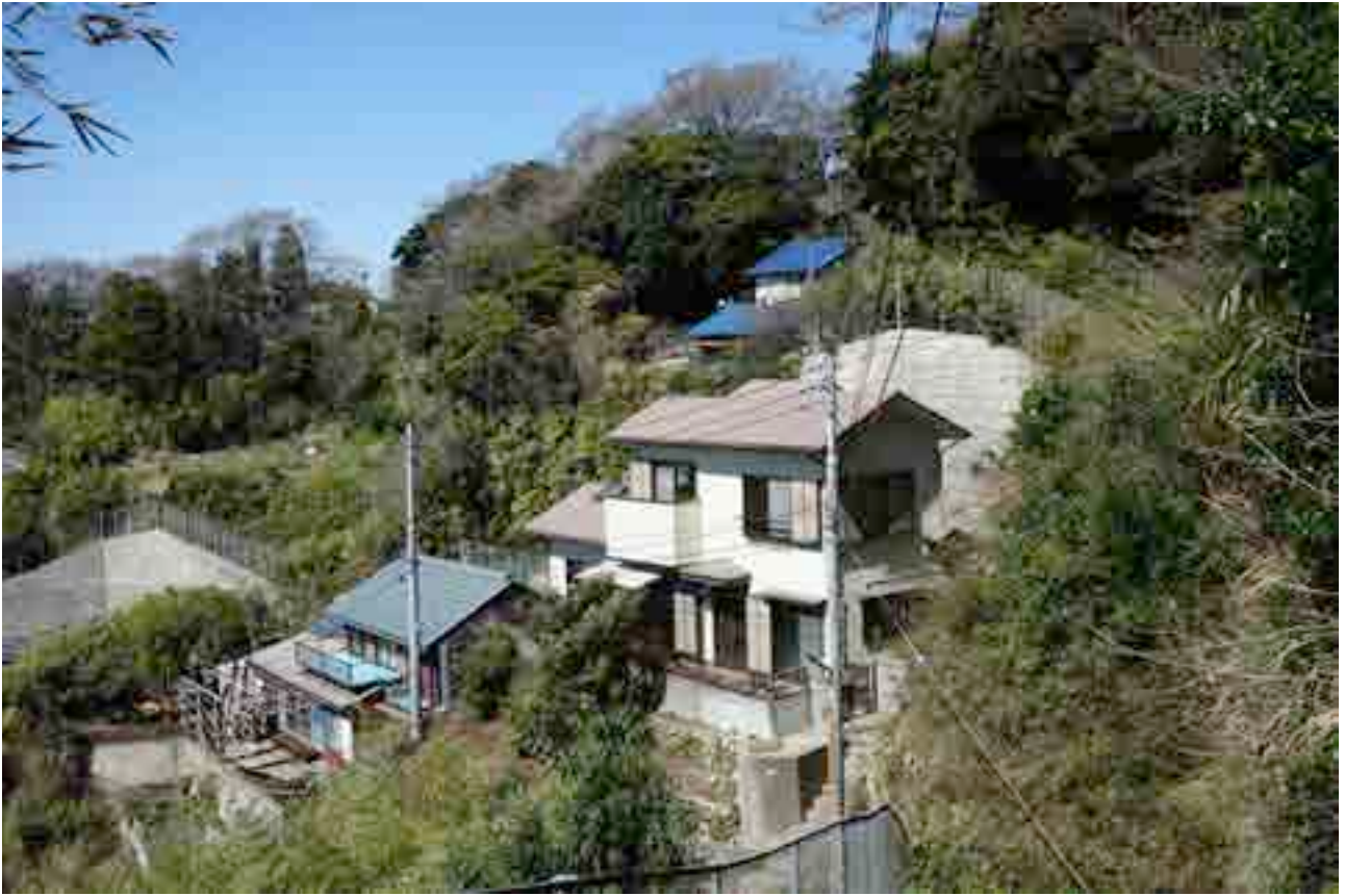
追浜の高台に立地（白いお家です。）