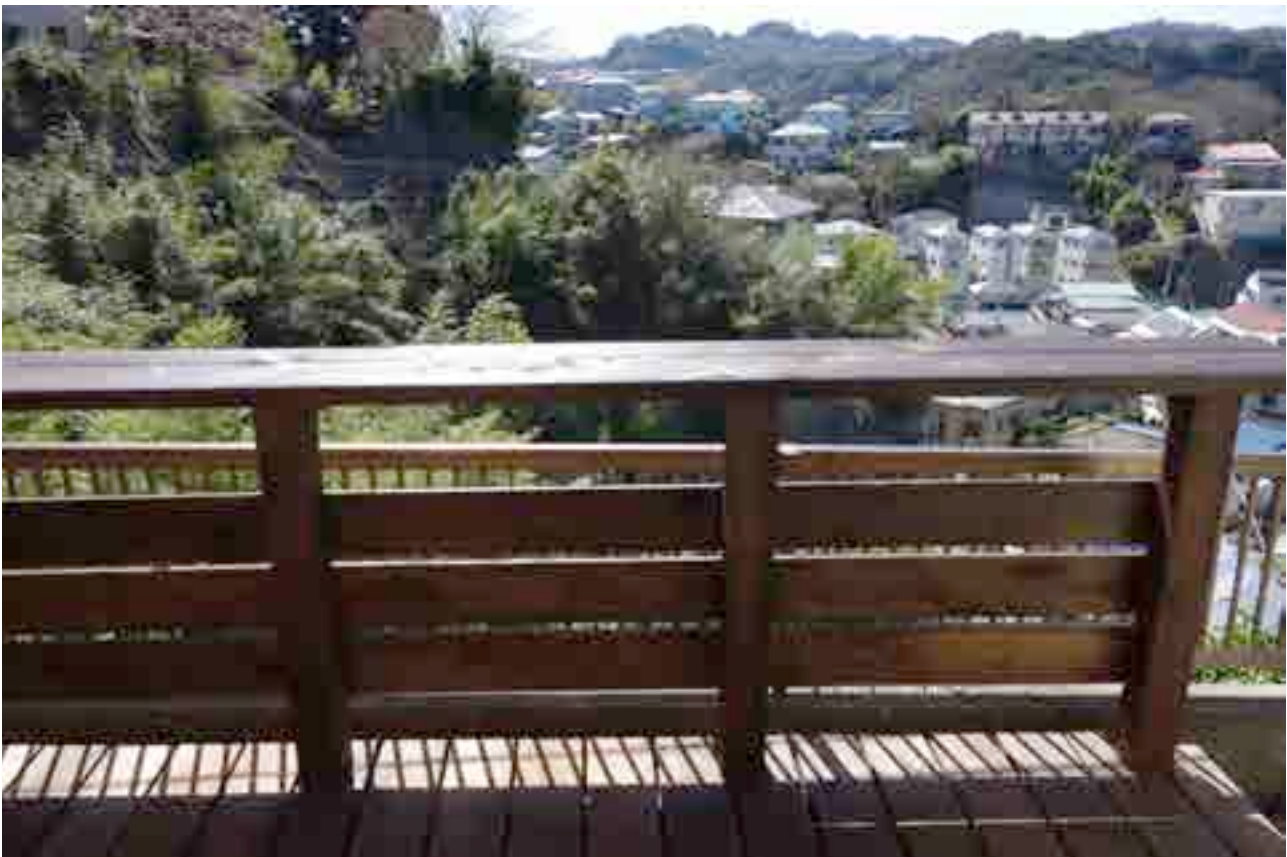
共用部 テラス（ここでビールも飲みたい！）