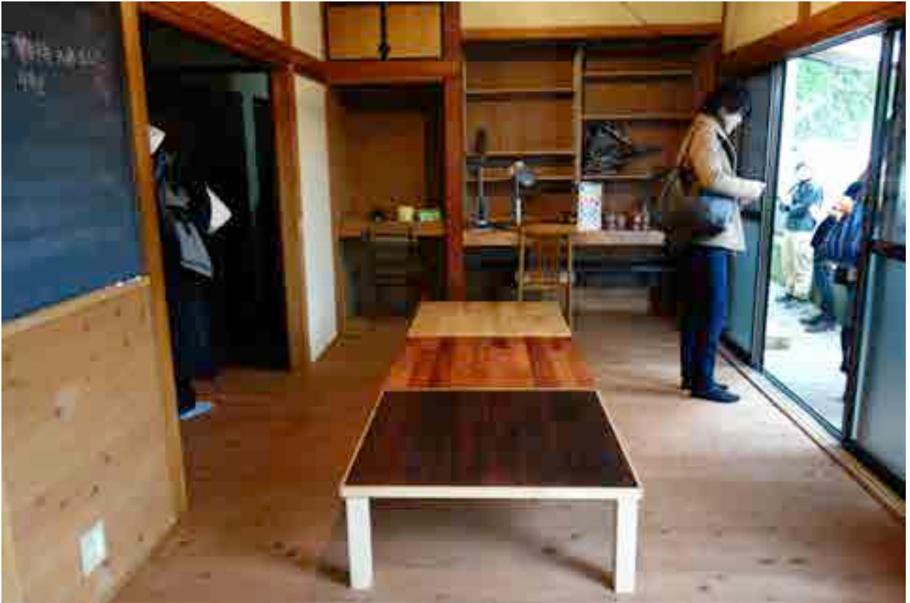
共用部 LDK（机は脚をのばして、テーブル・作業台にもなります）