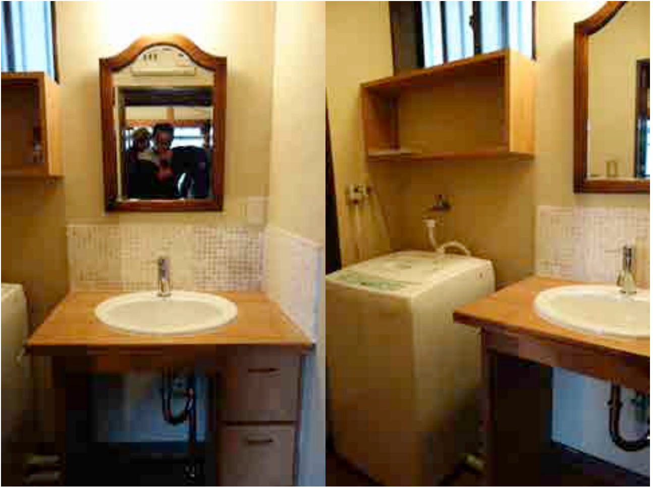
共用部 洗面・脱衣室