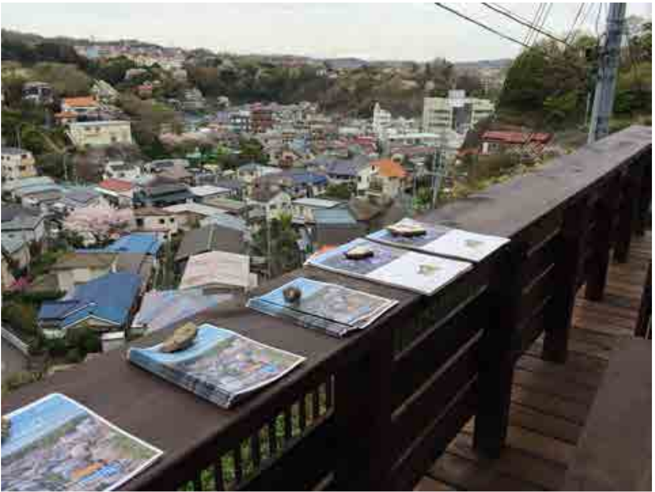
共用部 テラス（ここでの食事は最高！）