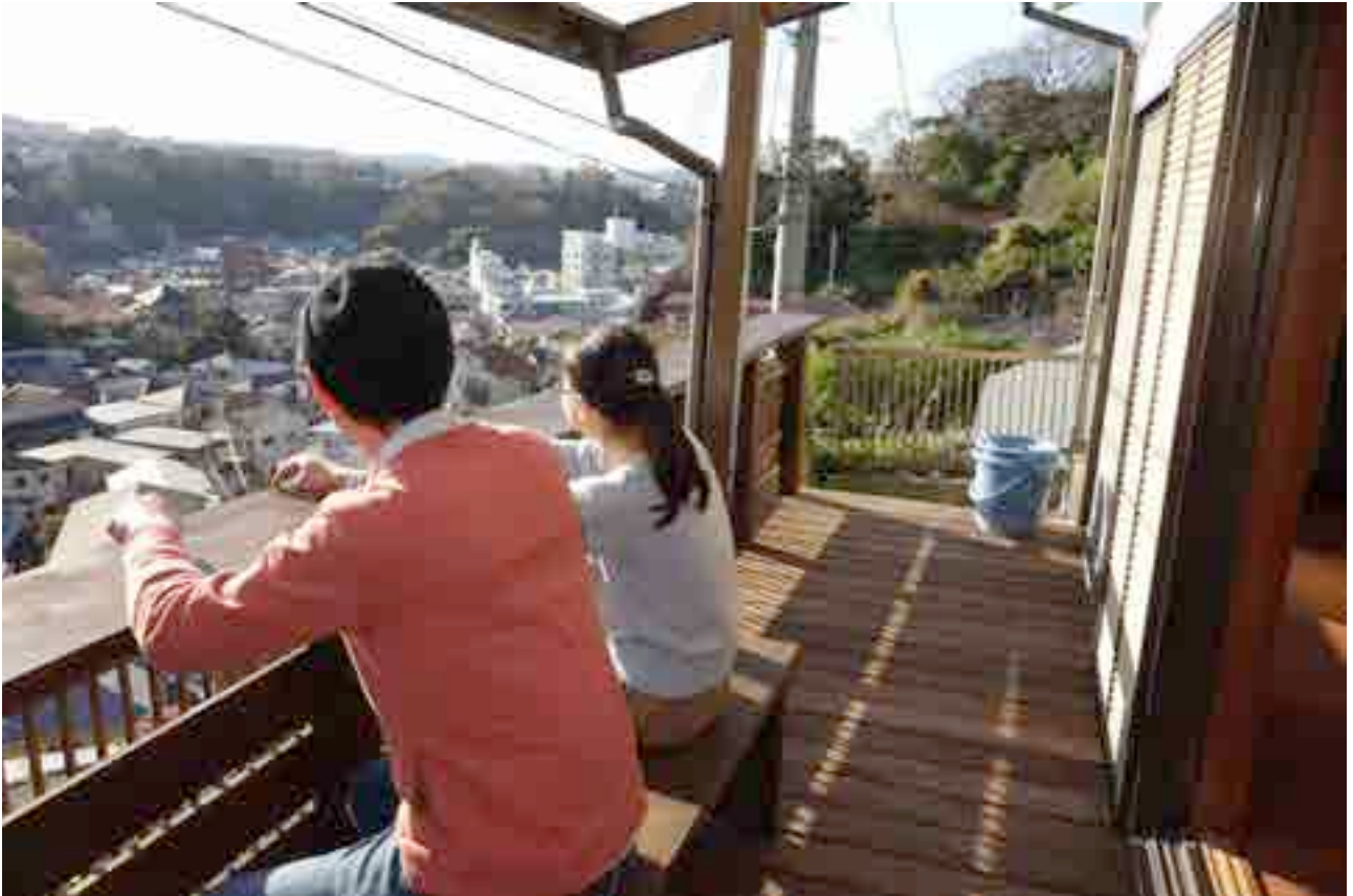
共用部 テラス（カウンター付きの広いテラスから追浜のまちを一望）