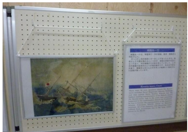
咸臨丸パネル展示