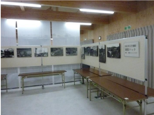
ドック写真