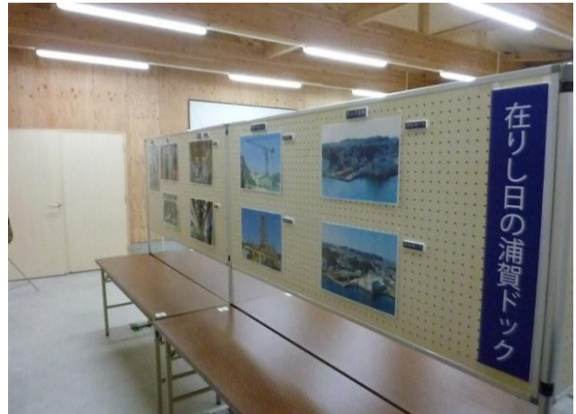
過去のドック施設写真