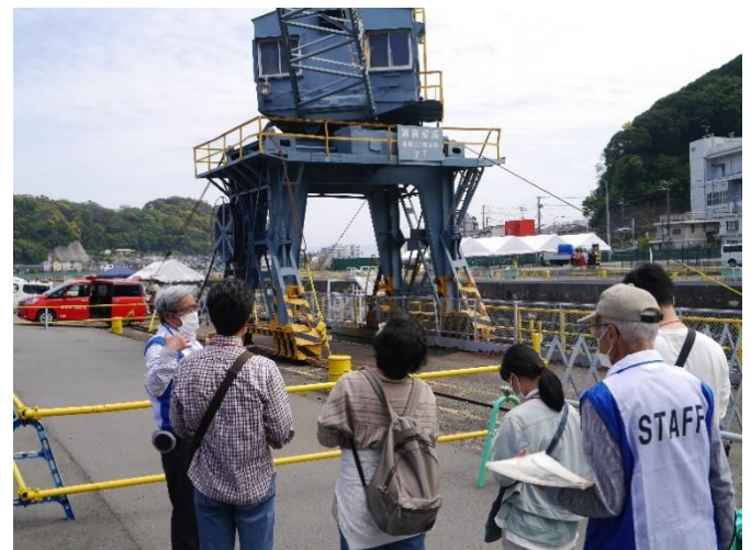
ジブクレーンの説明を聞く参加者