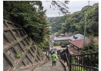
もう少しでゴール！