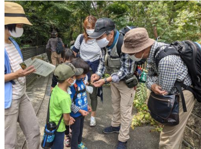
近くで観察してみよう