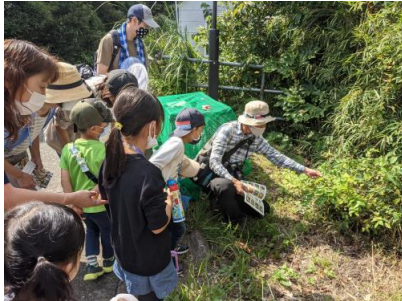
さっそく生きもの発見